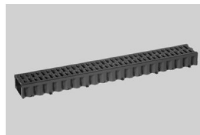
Canal Hexaline® 1 m com grelha em polipropileno cor preta