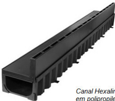
Canal Hexaline® 1 m com grelha ranhurada Brickslot em polipropileno cor preta