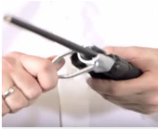
5º Passo – Apertar com uma chave ambos os lados do conetor