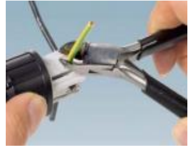
3º Passo – Cortar todos os fios o