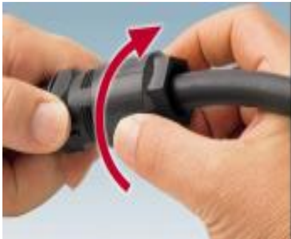
4º Passo – Ligar por aperto a porca plástica com a parte central do conetor