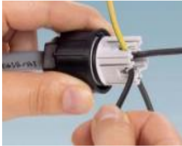
2º Passo – Enfiar o cabo e dobrar cada fio passando pelas garras