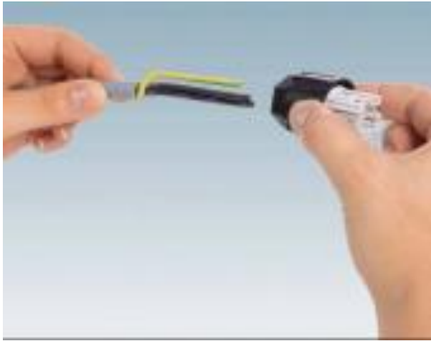
1º Passo – Fazer o descarnar o isolamento exterior do cabo deixando os fios interiores com cerca de 6 cm