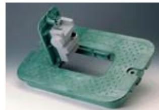
Tampa VB1419U com painel de acesso para montar caixa de comando TBOS™